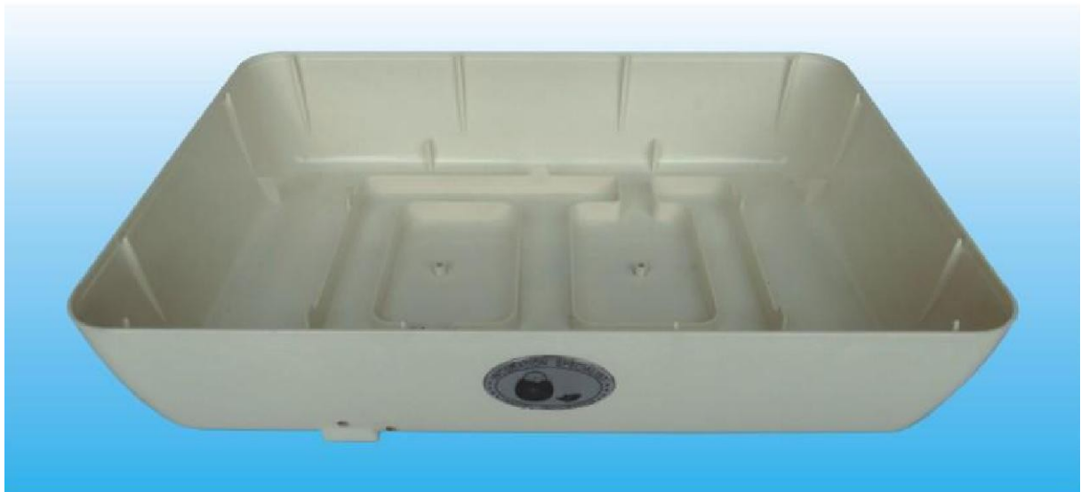
Obrázek 1: Základna se dvěma vodními kanálky a dvěma dírami na bocích pro dolévání vody. Příklad: nalijte 300-350 ml vody, poté každý následující den nalijte 100-150 ml vody. Na poslední 3 dny před vylíhnutím doplňte dalších 200-250 ml i do druhého vodního kanálku.