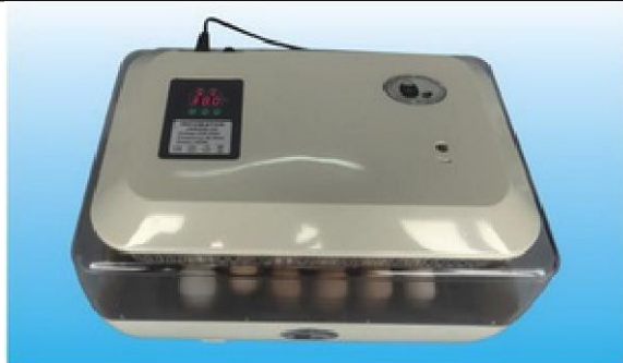
Obrázek 6: Na zadní části líhně je pojistka. Je pro bezpečnost provozu líhně. V žádném případě ji nevyndavejte nebo neničte. Příklad by pak nešel zapnout.

Po zapojení líhně do zásuvky začne na display blikat "L". Signalizuje to nízkou teplotu (líheň není nahřáta). Větrací otvor na víku zcela otevřete.