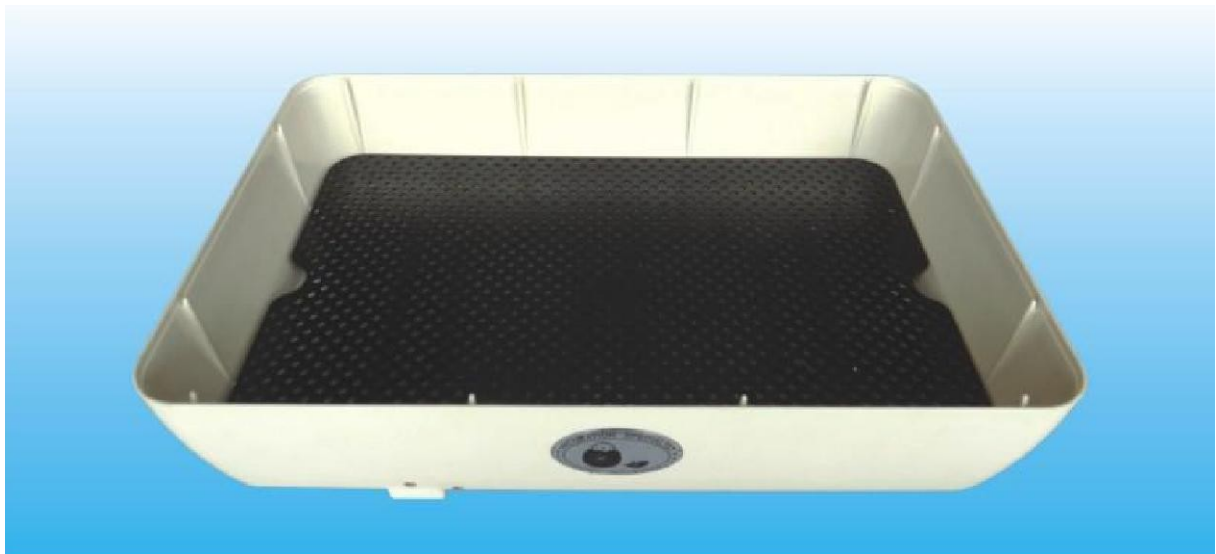
Obrázek 2: Perforovaná podlážka