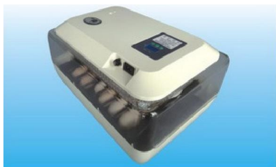
Obrázek 5: Zaklapněte líheň horním víkem. A zapojte do zásuvky.