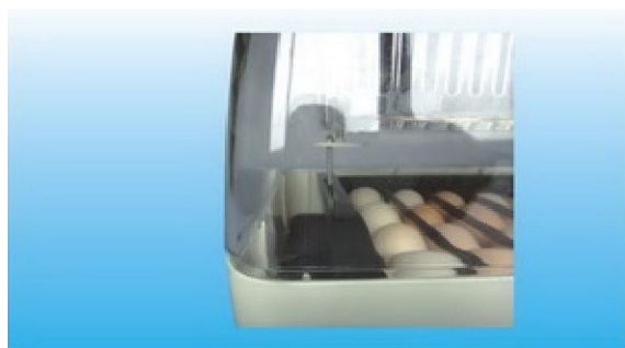
Obrázek 4: Dejte velký pozor, zda je otočná tyčka motoru správně umístěna a může tak svým otáčením posouvat rošt. Motor je stále v chodu a vejce pomalu otáčí v průběhu cca. 4 hodin.