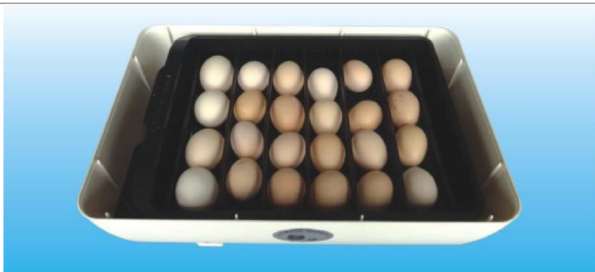
Obrázek 3: Vložte vejce do lísek na vejce. Je nutno udělat vejci prostor – proto je potřeba vůle 5-10 mm z obou stran.