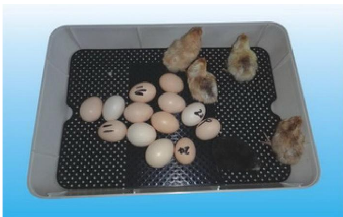
Obrázek 7: Při líhnutí kuřat, 18. den vyjměte posuvnou část a vejce umístěte na plastovou podlahu. Zvyšte vlhkost naplněním i druhého vodního kanálku. Po vylíhnutí nechte kuřata v líhni 24 hodin uschnout.

Po zapojení líhně do zásuvky začne na display blikat "L". Signalizuje to nízkou teplotu (líheň není nahřáta). Větrací otvor na víku zcela otevřete.